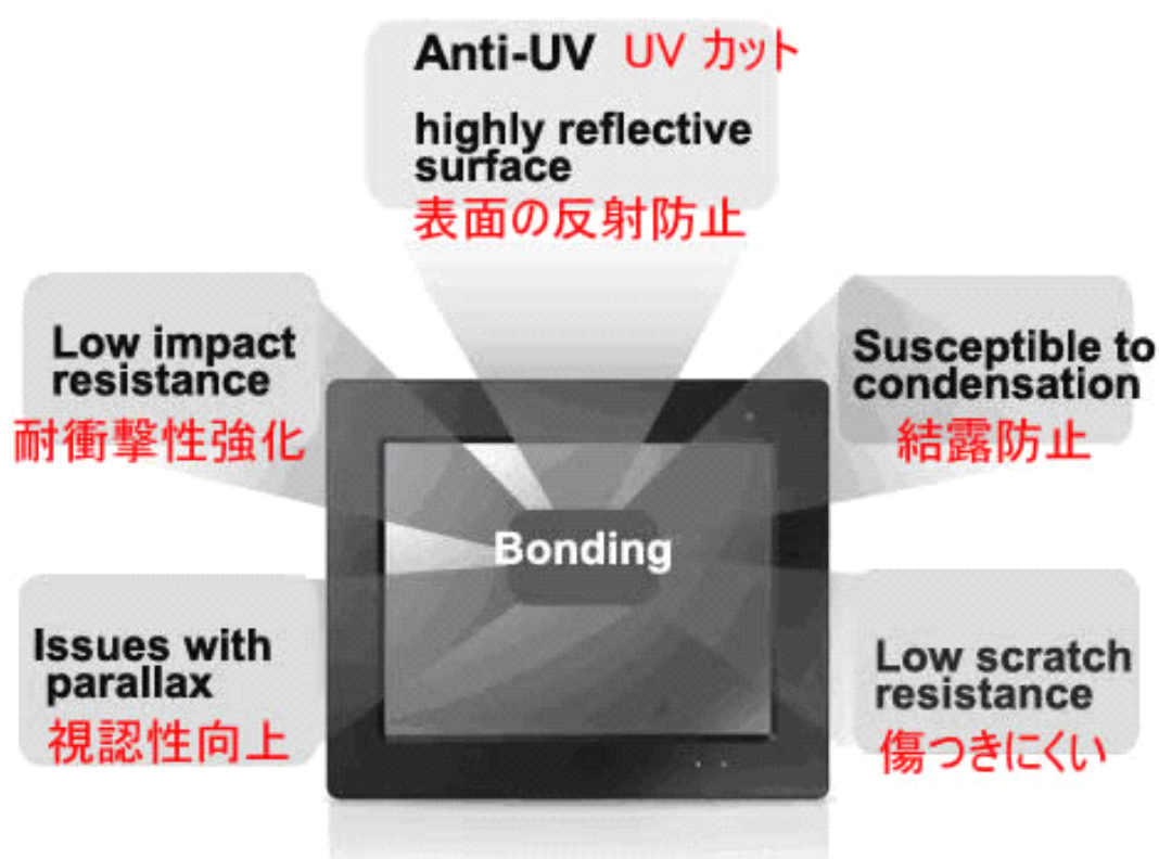
図： オプティカル・ボンディングの長所

オプティカル・ボンディングは反射光を抑える機能があるだけでなく、パネル面の老化を防ぐ機能も併せ持ち、さらにパネル面の強度と衝撃への抵抗力も増強させることができます。加えて、さらに価値のある機能と致しましては、パネル内部の結露防止にも役立つ点ですが、温度差の激しい環境下での結露防止は重要な機能の1つとなります。