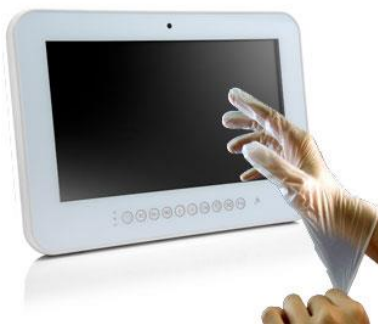
図： 4 層構造の医療用ラテックス・ゴム手袋

WMP-153 では投影型静電容量 10 ポイント・マルチ・タッチパネルを採用していることで、タッチ操作で「ズームイン」、「ズームアウト」や「スワイプ」などの直観的な操作も容易となりますし、医療機関では手袋を利用される機会が多いため、WMP-153 ではタッチパネルの感度も高め、医療用の 4 層構造のラテックス・ゴム手袋などもご利用可能な設計となっております。また、清潔さが求められる医療環境に適合するため、タッチパネル部のフロントパネルはシームレスな全面フルフラット構造となっており、IP65 適合の防塵・防滴設計で、背面は直下の水滴から影響を受けない IPX1 設計となっております。加えて、医療用 MRSA 抗菌対応プラスチック筐体を採用していることで細菌の繁殖を抑えることができ、従来機種と同様に『Clean me』ボタン(画面の消毒・清掃時にタッチ機能とボタン機能を 3 分間一時停止、再度の長押しで復帰可)も標準装備していることで電源 ON 時でも容易に画面を清掃することも可能です。更に完全なファンレスを実現することで、故障原因も減らせると同時に、医療機関で必要とされる静穏環境も保てる設計となっております。