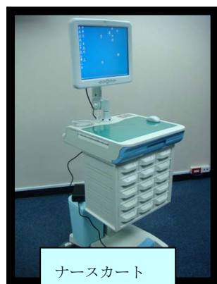
図： WMP-176 の各種アプリケーション例： 左から「ナースカート」、「電子カルテ」、「ベッドサイド端末」

WMP-176 は 17 インチの抵抗膜タッチパネルを標準装備し、輝度: 380 cd/m 2 の液晶パネルを採用しており、全面抗菌加工と HDD 衝撃吸収機構は従来通りですが、WMP-176 では、医療用規格の 60601-1 第 3 版に適合しております。また、それ以外でも多彩なオプションも選択可能となっております。