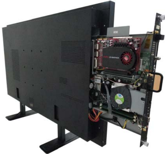
図： WMS-Plus3 スロット式の引出し設計

多くのデジタルサイネージ用製品(端末)と比較して Wincomm WMS-PLUS3 の最も大きな相違点は、マザーボードやグラフィック・ボードなどを容易に取り出せるようにスロット方式を採用している点です。下図のようにスロット方式で引き出すことが可能ですので、メンテナンスは非常に便利な設計となっております。また、液晶パネル一体型ですので、省スペースとなり、壁掛けや天井吊りなども簡単に設定も容易となります。