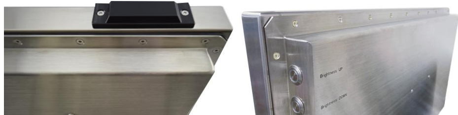
図 2. フラット型の無線 LAN アンテナと輝度調整ボタン (防水・防塵ステンレス筐体 [標準 SUS304])

IP66/IP69K 対応の完全防塵・防水ステンレス筐体タッチパネル PC『WTP シリーズ』では全機種にて基板内蔵型のフラット・タイプの無線 LAN アンテナを搭載可能ですので、IP69Kにも対応しております。ステンレスは耐蝕性の高い SUS304 を採用しております。また、『WTP-9H66 シリーズ』では輝度調整ボタンが装備されており、オプションで防水スピーカの搭載も可能です。