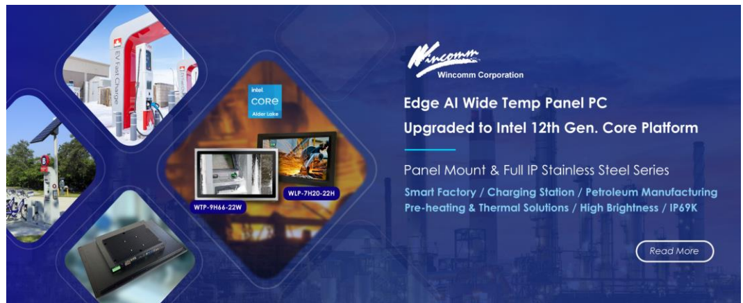
図 1. Alder Lake Core-i5 搭載の高輝度液晶版 WLP-7H20-15H と完全防塵・防水の WTP-9H66-15W

台湾の産業用及び医療用コンピュータ業界でリードする Wincomm ではこの度、主に組込み向けファンレス・パネル PC シリーズの 21.5 型高性能モデルにて高輝度・広範囲動作温度対応版の『WLP-7H20-22H』をリリース致しました。同時に IP66 対応の完全防塵・防水ステンレス筐体の 21.5 型高性能モデルにて広範囲動作温度対応版の『WTP-9H66-22W』をリリース致しました。同シリーズでは共に高性能の Intel 第 12 世代 Core i5-1245UE (Alder Lake) CPU を搭載し、完全なファンレス設計となります。動作温度も共に -20°C ~ 60°C を実現しており、『WLP-7H20-22H』では高輝度 ( 1,000 cd/m 2 ) の液晶パネルを搭載し、フロントベゼル(タッチパネル部)は IP66 対応の防塵・防水となります。『WTP-9H66-22W』では、 IP69K (高温、高水圧、スチームジェット洗浄で有害な影響を受けない)にも対応可能です。